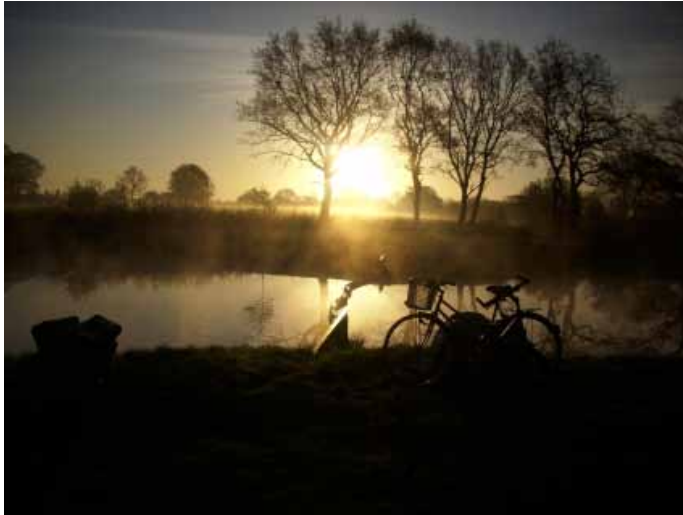
Wann erlebt man schon einmal solch einen Sonnenaufgang)